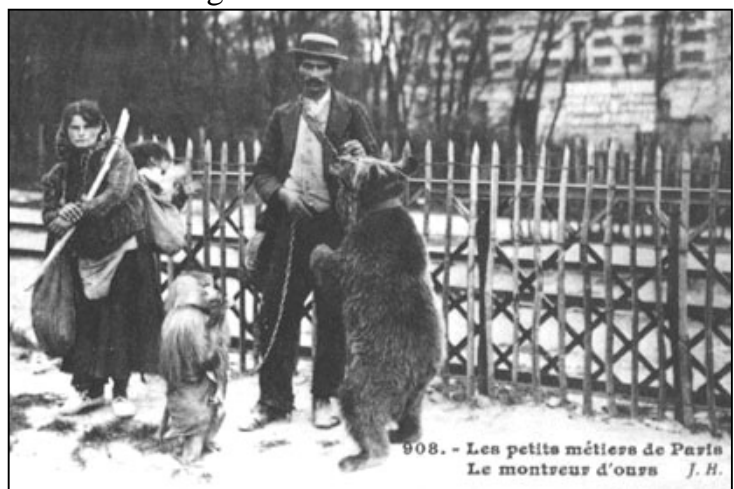
▲ Vorführen von Bär und Affen in Paris um 1902

Auf österreichischer Seite lief auch nicht alles am verwaltungsmäßigen Schnürchen.