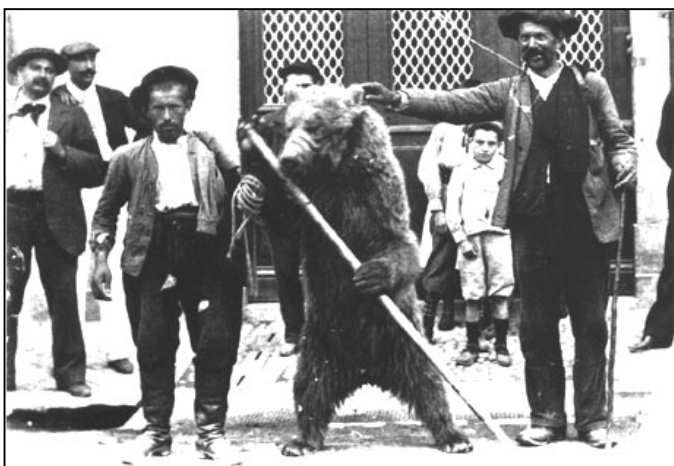
▲ Bärenführer in den Pyrenäen