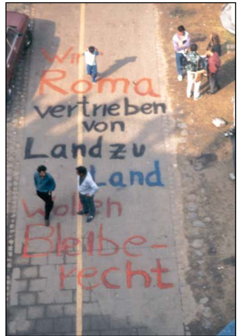
▲Düsseldorf, Knie-Brücke (Foto: Ch. Jung, 1991)

Weitere Informationen finden sich ab August im Internet unter http://www.romev.de .